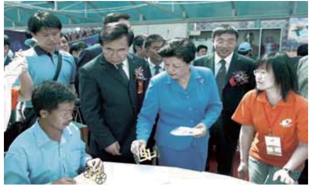
中科院常务副院长白春礼陪同国务委员陈至立参加“公众科学日”。

2007年5月19日在中科院奥运科技园举办了大规模的“公众科学日”活动，组织了78家科研院（所）向公众开放，集中开展大范围的科普活动。举办了科技讲座、动手实践、科普报告、成果展示等一系列丰富多彩的科技活动。