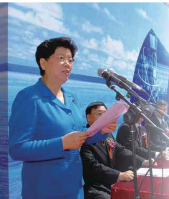
国务院委员陈至立在2007年科技活动周开幕式上发表重要讲话。