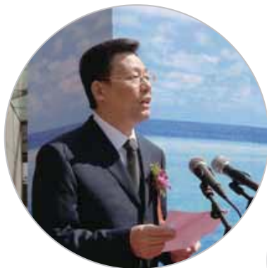
科技部党组书记、副部长李学勇介绍2007年科技活动周情况。