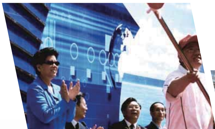
■ 国务委员陈至立向“科技列车大别山行”科技服务队授旗。