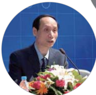
中宣部副部长翟卫华主持开幕式。