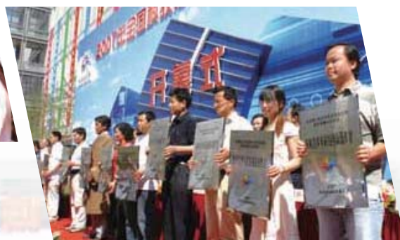
■ 向中西部农村学校赠送“农村青少年科技创新操作室”。