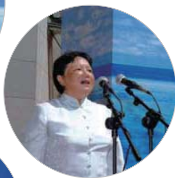
中国科协副主席、书记处第一书记邓楠宣布2007年科技活动周开幕。